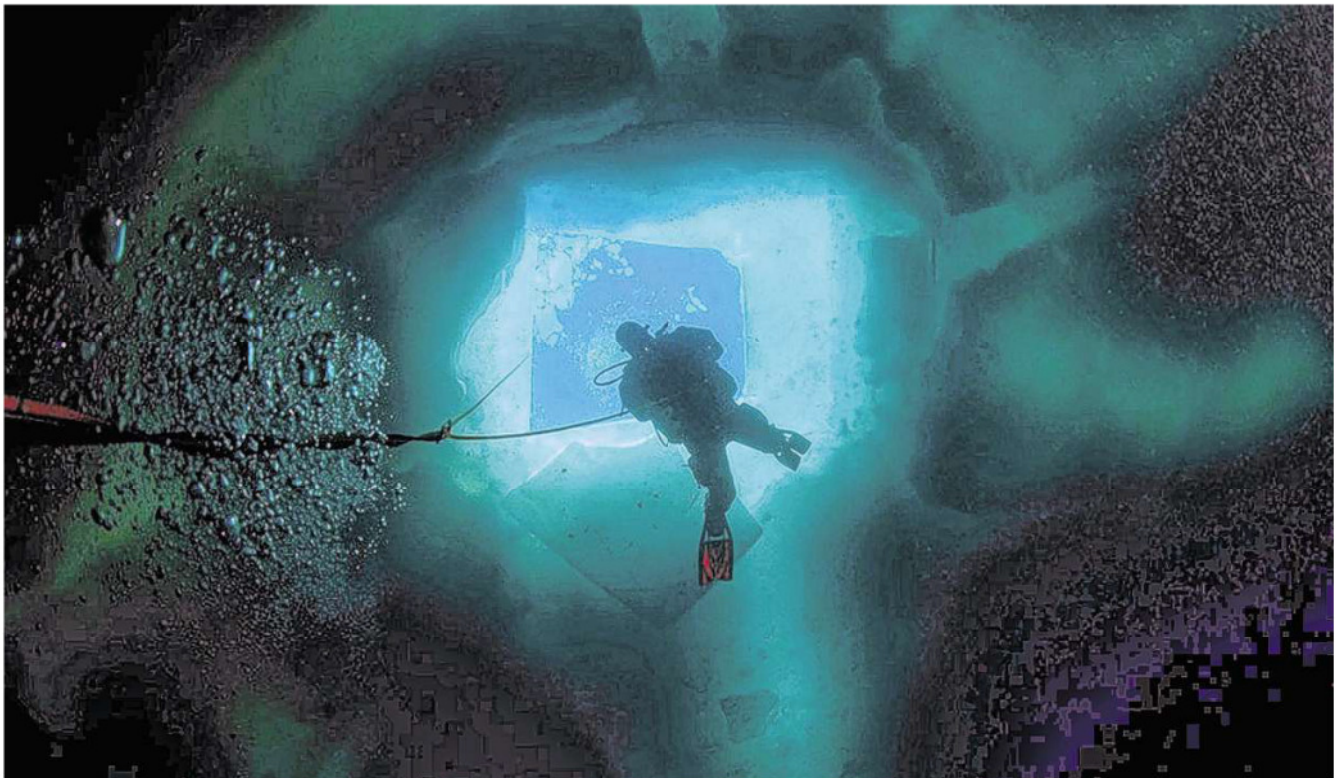
Abgetaucht: Beim Eistauchen kommt es nicht auf Tiefe oder Strecke an. Es ist der Blick nach oben, der zählt.