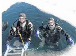
Geschafft: Jetzt aber nix wie raus aus dem kalten Wasser.

Unter den vielen Tiroler Seen zählt der auf 960 Meter Höhe gelegene Urisee zu Hinterlangs absoluten Favoriten: Die Sichtweiten können unter dem Eis bis weit über 30 Meter betragen. Der See ist von Januar bis März total zugefroren und hat eine Eisdecke von bis zu 40 Zentimetern Stärke. Das sieht gigantisch aus. Ebenso wie die Landschaft, die den See umgibt, schwärmt der Taucher. Der Schnee liegt dick auf den Tannen, und die Männer versinken bis zu den Waden im flöckigen Pulver, das bei jedem Schritt unter den Stiefeln knirscht: ein Wintermärchen. „Ich habe in den 80er Jahren mal Bilder vom Eistauchen gesehen und wollte das un-